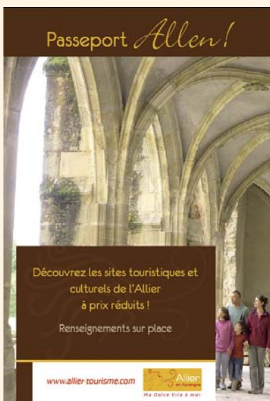
Présentoir du Pass

« Diffusé gratuitement, le passeport Allen! 2008 est disponible auprès des sites partenaires et des Offices de Tourisme. »